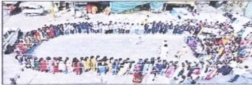
మానవహారంగా ఏర్పడి నినాదాలు చేస్తున్న విద్యార్థులు