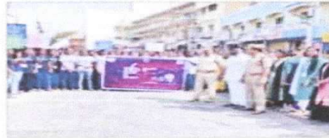
ర్యాలీ నిర్వహిస్తున్న విద్యార్థులు